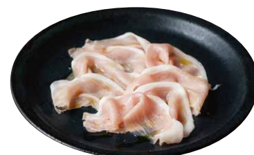
ぐんま麦豚の生ハム PORK CURED HAM