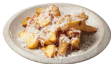
フレンチフライ FRENCH FRIES