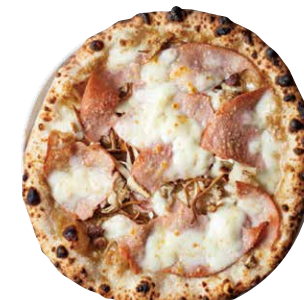
ポルチーニ PORCINI ■ ポルチーニソース ■ モルタデッラ ■ モッツアレラ ■ バター ■ 5種のきのこ