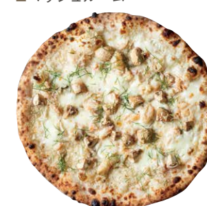
グランキオ GRANCHIO ■ 根セロリソース ■ カニ身 ■ カニミソ ■ 百合根 ■ モッツアレラ ■ デイル