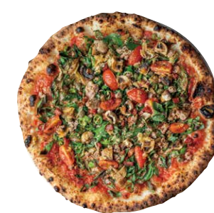
🔥🔥 サラメ ピカンテ SALAME PICCANTE ■ トマトソース ■ ミニトマト ■ 九条ネギ ■ 青唐辛子 ■ ピカンテサラミ ■ にんにく ■ サルシッチャ ■ 黒七味 ■ マッシュルーム