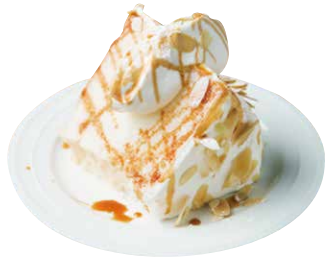
エンゼルフードケーキ 780 ANGEL FOOD CAKE