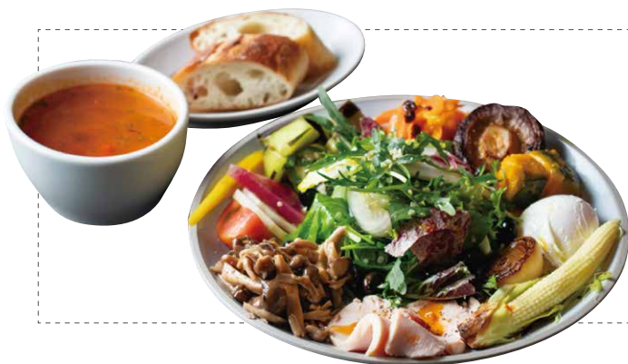
ベジプレートランチ VEGETABLE PLATE LUNCH (スープ + パン)

*ヴィーガン対応にも変更できます。 You can change this plate to be vegan-friendly as well.