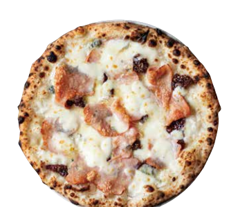
フィーコ FICO ■ リコッタチーズ ■ いちじく ■ ゴルゴンゾーラ ■ モルタデッラ ■ モッツアレラ