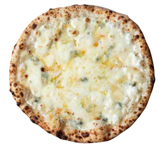
クアトロフォルマッジ QUATTRO FORMAGGI ■ ゴルゴンゾーラ ■ タレッジョ ■ リコッタチーズ ■ モッツアレラ ■ プロヴォローネ