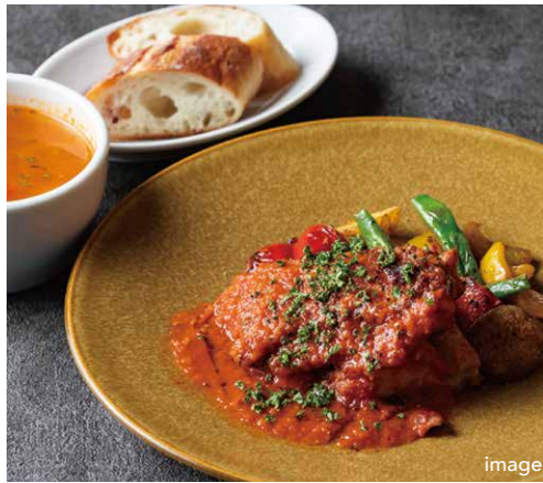
本日のプレートランチ TODAY'S PLATE LUNCH (スープ + パン or ライス)