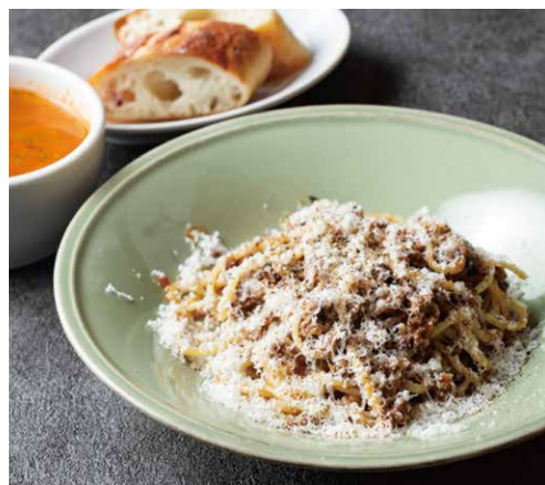
和牛ボロネーゼ 生パスタ WAGYU BOLOGNESE FRESH PASTA (スープ + パン)