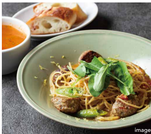
本日のパスタランチ TODAY'S PASTA LUNCH (スープ + パン)