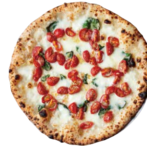
DOC 水牛モッツアレラと チェリートマト MARGHERITA BIANCA ■ チェリートマト ■ バジル ■ 水牛モッツアレラ