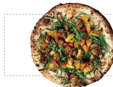
ヴェルドゥーレ VERDURE ■ 九条ネギ ■ 揚げナス ■ きんぴらレンコン ■ ペペロナータ ■ 焼き芋 ■ 自家製セミドライトマト