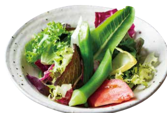
ミニサラダ SMALL SALAD