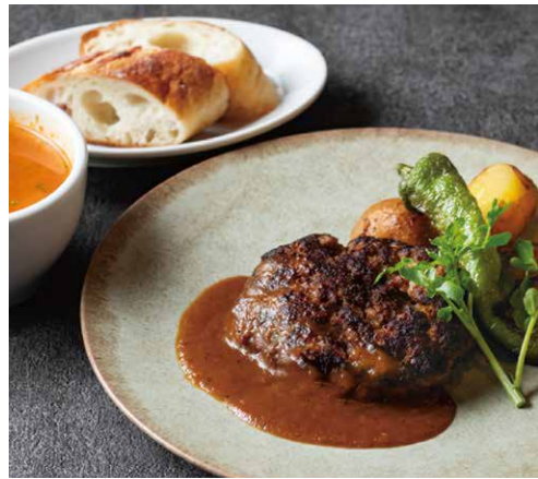
淡路牛ハンバーグステーキ AWAJI LOCAL BEEF HAMBURGER STEAK (スープ + パン or ライス)