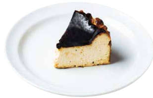
バスクチーズケーキ 780 BASQUE CHEESECAKE