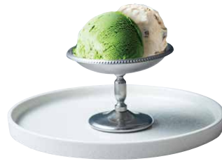
辻喜抹茶アイスと ラムレーズンのアイス 750 MATCHA & RUM RAISIN ICECREAM