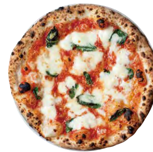
マルゲリータ 1700 MARGHERITA ■ トマトソース ■ モッツアレラ ■ バジル

窯焼きのピZZAを単品でご注文いただけます Oven-baked pizzas can be ordered separately.