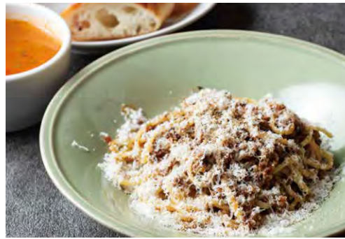
和牛ボロネーゼ 生パスタ 1800 WAGYU BOLOGNESE FRESH PASTA (スープ + パン)