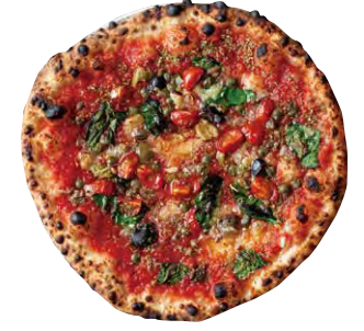
ナポレターナ 1700 NAPOLETANA ■ トマトソース ■ ケッパー ■ オリーブ ■ ニンニク ■ アンチョビ ■ チェリートマト