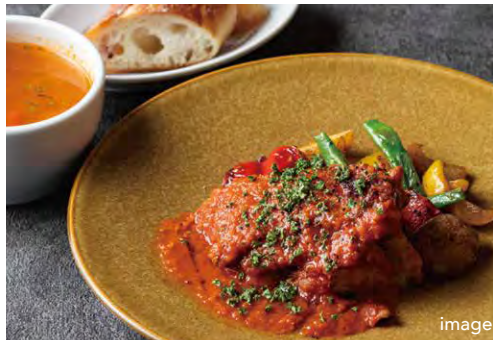
本日のプレートランチ 1750 TODAY'S PLATE LUNCH (スープ + パン or ライス)