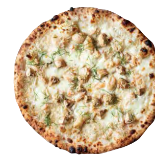
グランキオ 3300 GRANCHIO ■ 根セロリソース ■ カニ身 ■ カニミソ ■ 百合根 ■ モッツアレラ ■ デイル