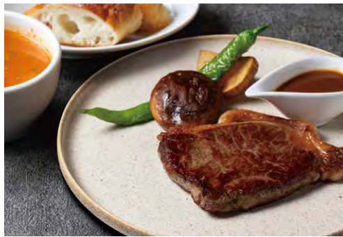
淡路牛サーロインステーキ [150g] 3500 AWAJI LOCAL BEEF SIRLOIN STEAK (スープ + パン)