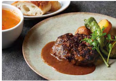
淡路牛ハンバーグステーキ 1950 AWAJI LOCAL BEEF HAMBURGER STEAK (スープ + パン or ライス)