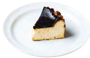
バスクチーズケーキ 780 BASQUE CHEESECAKE