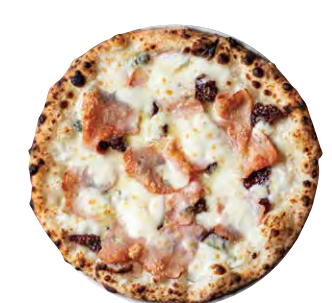
フィーコ 2700 FICO ■ リコッタチーズ ■ いちじく ■ ゴルゴンゾーラ ■ モルタデッラ ■ モッツアレラ