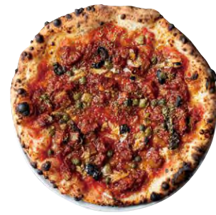
🔥 ポルポアラビアータ 1900 POLPO ARRABBIATA ■ タコのトマト煮込み ■ オリーブ ■ ケッパー ■ 唐辛子 ■ ニンニク ■ セロリ