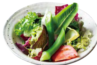
ミニサラダ 450 SMALL SALAD

窯焼きのピZZAを単品でご注文いただけます Oven-baked pizzas can be ordered separately.