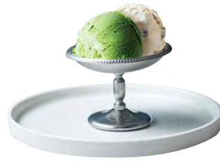
辻喜抹茶アイスと ラムレーズンのアイス 750 MATCHA & RUM RAISIN ICECREAM