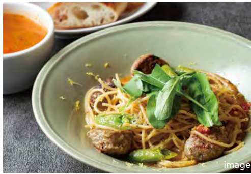
本日のパスタランチ 1650 TODAY'S PASTA LUNCH (スープ + パン)